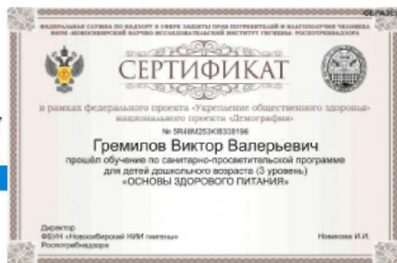
Рис. 15. – Просмотр результатов итогового тестирования и получение сертификата, подтверждающего успешность прохождения обучения

В случае если набрано менее 80% правильных ответов, Программа указывает проблемные разделы и предлагает пройти тестирование повторно. Количество повторных тестирований не ограничено по количеству, но ограничено по времени. Повторное тестирование можно пройти не ранее чем через 24 часа от предыдущего тестирования.